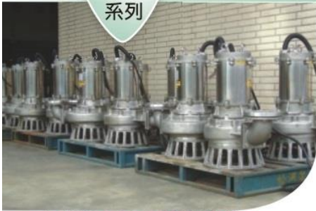
高科技電子廠專用污水排放泵